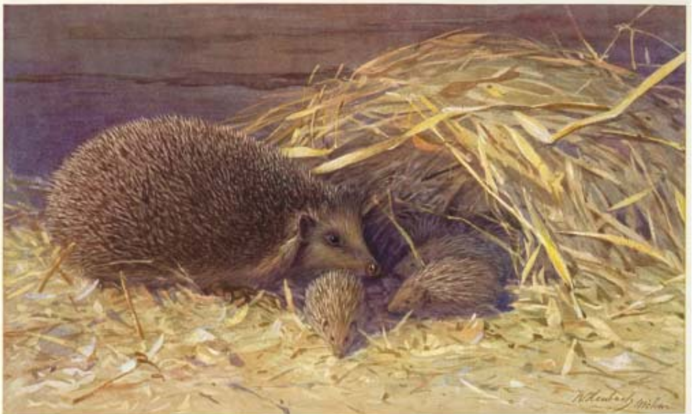
W. Heubach - Zeichnung aus „Brehms Tierleben“, Leipzig, 1922.