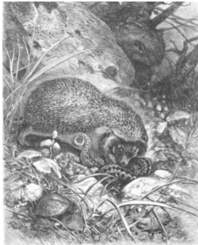
„Der Igel im Kampfe mit der Kreuzotter“

Erstaunlich ist der Befund, dass auch im Blut des Menschen ähnliche Moleküle vorkommen, die hier offenbar als Abwehrstoffe gegen eindringende Fremdorganismen wie z.B. Bakterien dienen. Sie bilden offenbar die erste Verteidigungslinie gegenüber Krankheitserregern, noch bevor unser Immunsystem reagieren kann. Allerdings sind die